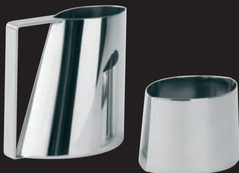
KERMA & SOKERI CREAM & SUGAR code 704