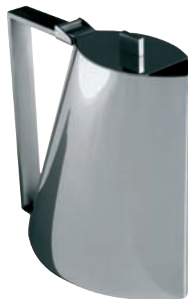
KAHVIKANNU 1,4 L COFFEE POT code 702

Kiillotettua terästä. Kädensija harjattu. Sarannoitu kansi.